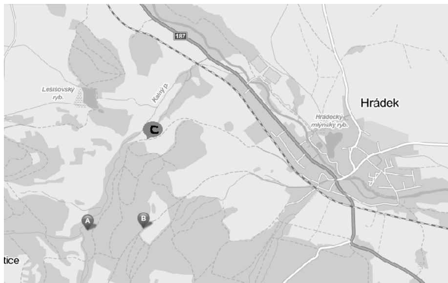
Mapka tábora u Hrádku u Sušice: místo A= tábořiště, místa B, C = místa vhodná k parkování při návštěvním dnu (dále prosím nejezděte).

Konec tábora skauti: 28. 7 mezi 11 a 12h.