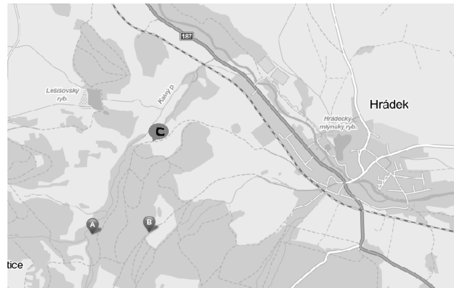
Mapka tábora u Hrádku u Sušice: místo A= tábořiště, místa B, C = místa vhodná k parkování při návštěvním dnu (dále prosím nejezděte).